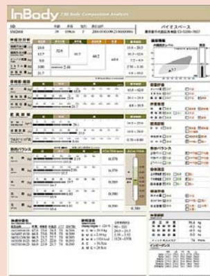
精密体組成測定結果